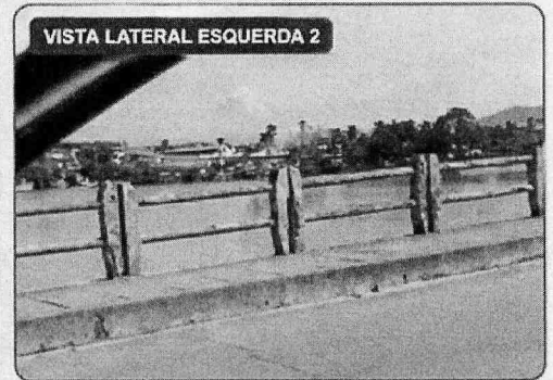
VISTA LATERAL ESQUERDA 2