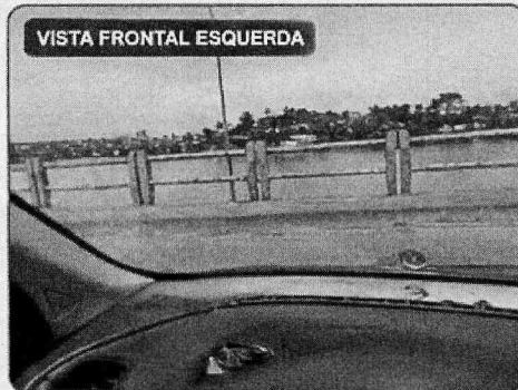
VISTA FRONTAL ESQUERDA