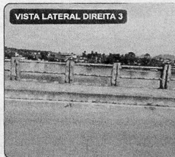
VISTA LATERAL DIREITA 3