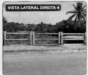
VISTA LATERAL DIREITA 4