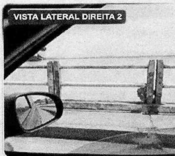
VISTA LATERAL DIREITA 2