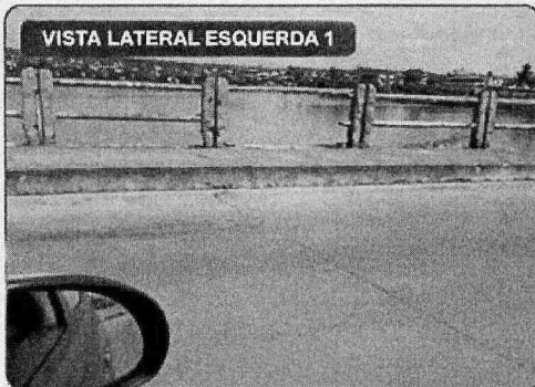
VISTA LATERAL ESQUERDA 1