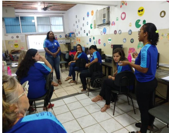
Apresentação do SCFV da equipe e dos usuários – Centro – Fundão/ES. (27/01/2020)

CONCASE 006/1999 COMASSE 0004/2015 COMIDS Utilidade Pública Estadual, Lei 5.810/1998 Utilidade Pública Municipal, Lei 3023/2006 CEBAS Portaria nº. 61/2018